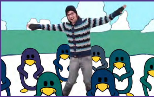
ICH BIN EIN PINGUIN