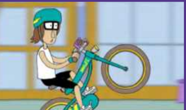
BALLER MIT MEINEM RAD

KONZERTANFRAGE & KONTAKT: info@herrh.com