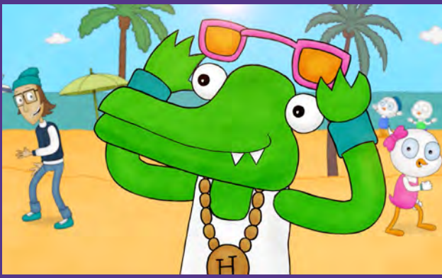
KALLE, DAS KROKODIL (MIAMI KALLE)