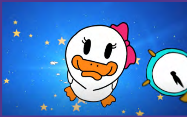
EMMA, DIE ENTE