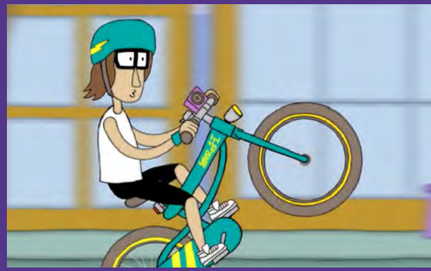
BALLER MIT MEINEM RAD