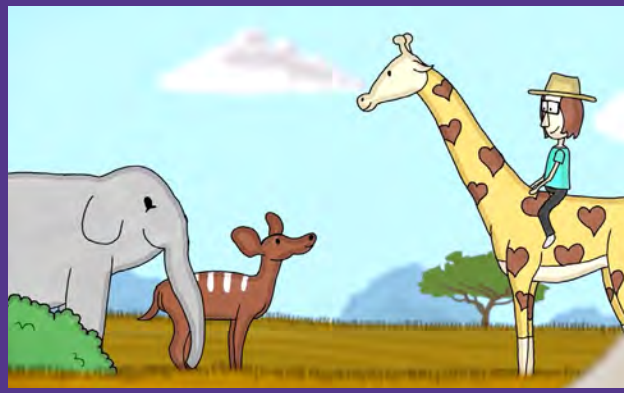
RAFFI, DIE GIRAFFE