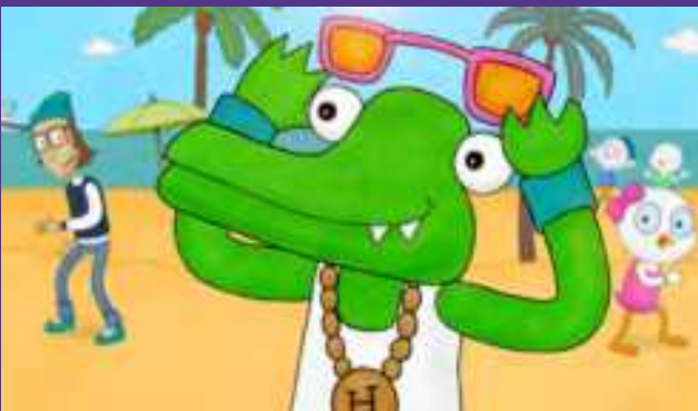
KALLE DAS KROKODIL (MIAMI KALLE)