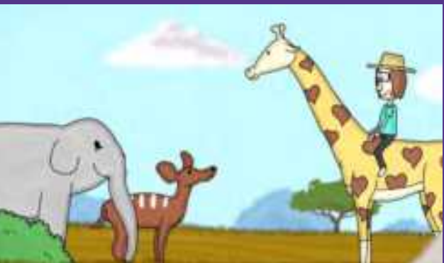
RAFFI, DIE GIRAFFE